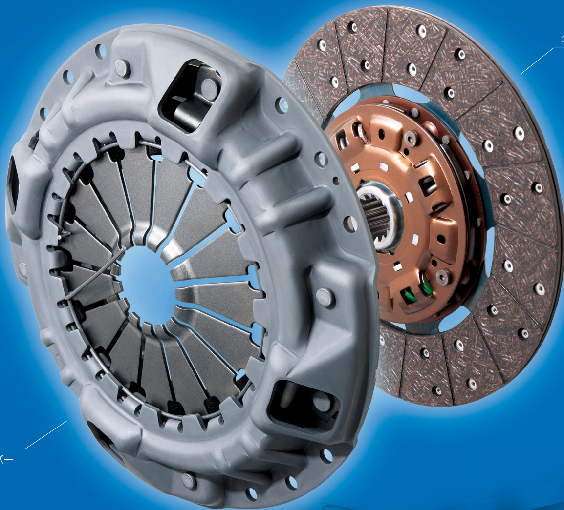
クラッチディスク