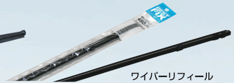
ワイパーリフィル

高級天然ゴムを使用しているため、拭き取り性能抜群。 汎用性の高いUクリップを標準装着しています。