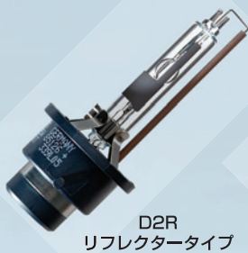
D2R リフレクタータイプ