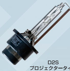
D2S プロジェクタータイプ