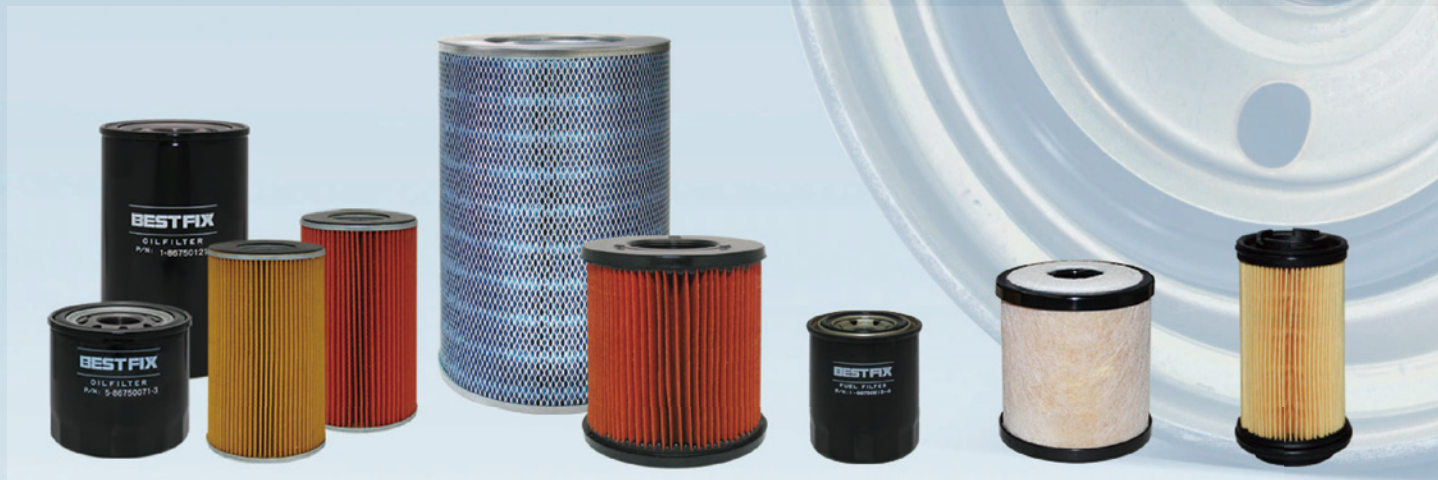
オイルフィルター